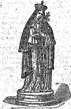
AN ITRON VARIA REMENGOL

Kær is ne ma mui, evel Saldm, Gómor ha Babylón; hak hirio ar môr a ruill dreist he fen.